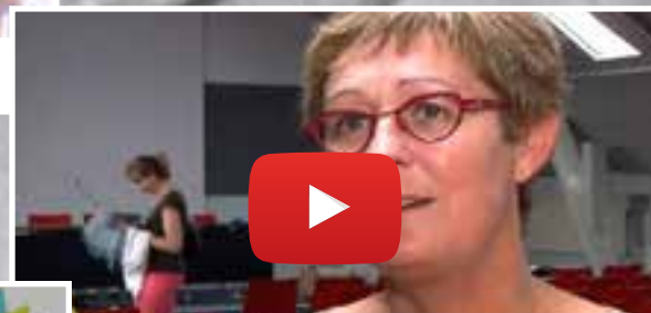
QUALITÉ DE L'AIR INTÉRIEUR