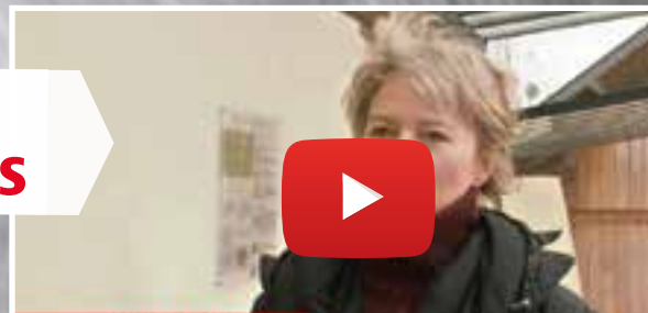
BIEN SE CHAUSSER